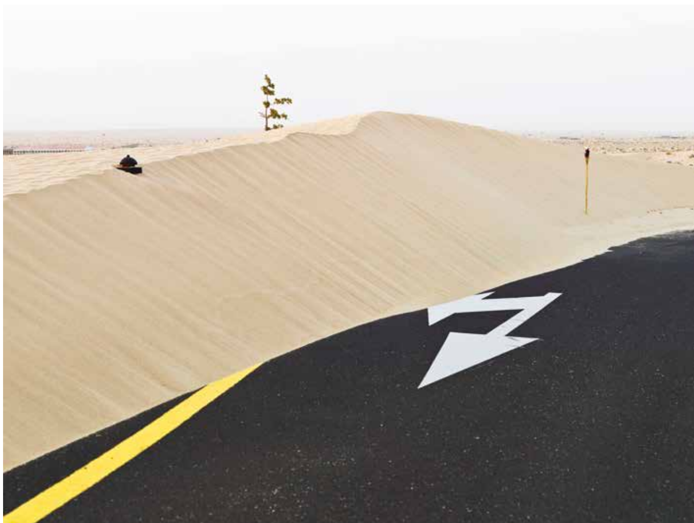
Datazone #02 - Emirats Arabes Unis, Abu Dhabi, 2007 / 2011.

De la Corée du Nord aux nouvelles routes de la soie, en passant par Haïti ou Fukushima aux blessures saillantes, Kaboul et ses seigneurs de guerre, ou encore le delta du Niger baigné de pétrole à l'écosystème suffocant... 14 lieux symptomatiques des fractures d'aujourd'hui. Philippe Chancel présente « Datazone » comme une constellation de points géographiques qui, une fois reliés, dresse l'état du monde, de ses souffrances sociales à écologiques. Depuis le début du siècle, le photographe sillonne la planète suivant les catastrophes, qu'elles soient climatiques ou engendrées par l'homme, se saisissant d'une information pour s'en faire sa propre expertise.