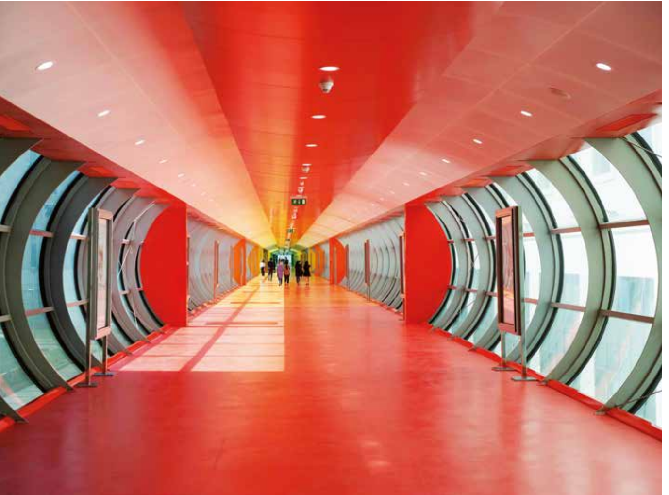
Datazone #07, Kazakhstan, Astana, 2013.