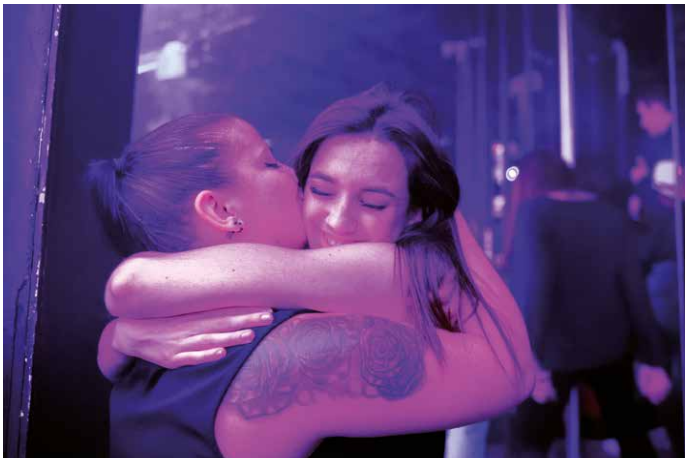
Vannes, 2019.

Ils ont 20 ans (ou presque) et vivent quelque part, sur un territoire avec ses contraintes et ses possibles. Cela fait cinq ans que Patrice Terraz a débuté un travail documentaire sur la jeunesse française. Il présente ici le fruit de ses rencontres avec ces jeunes nés à l'aube de l'an 2000, et plus particulièrement ceux qui ont en commun ce lien étroit avec la mer. Ils vivent en Nouvelle-Calédonie, en Guyane, à Saint-Pierre et Miquelon, et... à Vannes. Une jeunesse multiple et insaisissable, légère et à la fois sévère avec le monde qui l'entoure. Sans essayer d'en extraire une analyse sociologique, le photographe s'infiltré et retrace une réalité sans fioritures.