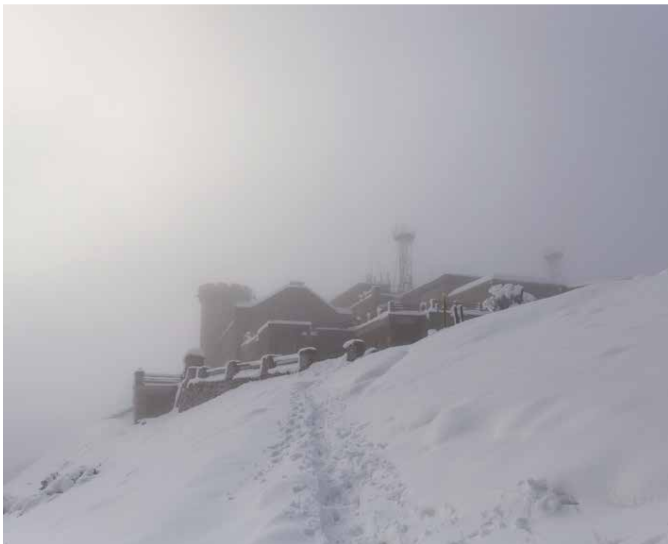
Observatoire du Mont Aigoual, janvier 2018.

Tels nos anciens gardiens de phare, les techniciens du dernier observatoire météorologique habité de France, exercent un métier en voie de disparition. Progressivement, les nouvelles technologies remplacent les anciens outils de mesure et les écrans prennent le pas sur l'expertise humaine. Rares sont aujourd'hui ceux qui sont en mesure de prédire les changements météorologiques en scrutant la nature qui les entoure. Florence Joubert réalise sur le toit des Cévennes un travail au long cours, à la fois documentaire et poétique qui interroge le visiteur sur son rapport à la nature. Les saisons s'enchaînent, les éléments se déchaînent sur cette forteresse du Mont Aigoual soumis à des phénomènes extrêmes dus