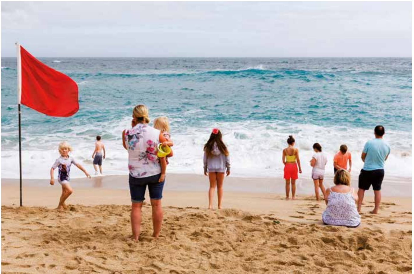
Porthcurno, Cornouailles, Angleterre, 2017.

6 Leave or not ? Les britanniques ont voté pour la sortie de l'Europe. Martin Parr est allé à la rencontre des régions qui ont massivement voté pour. Le photographe dresse un portrait espiègle mais bienveillant de ses compatriotes. On y croise ceux qui affichent leur patriotisme jusque dans leurs tenues vestimentaires, mais aussi des travailleurs ordinaires. Dans la diversité des personnages et scènes saisies, c'est toute la complexité de la question qui ressort. Si l'Europe créait il y a 20 ans une nouvelle monnaie, les partisans de la sortie de l'union gagnent progressivement du terrain vers un avenir incertain ou à reconstruire.